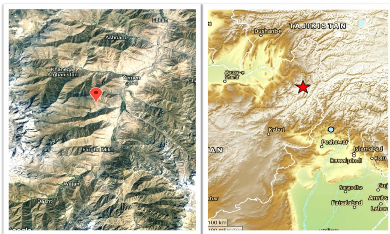
شکل ( ۱ و ۲ ) مرکز سطحی زلزله ۱۴۰۰/۹/۹ ولسوالی یمگان